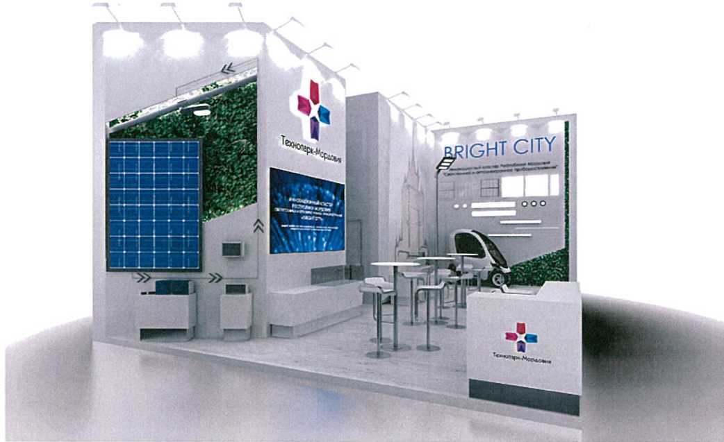
Дизайн - проект разработан ООО «Дарт» в интересах заказчика на территории Республики Мордовия в соответствии с законодательством РФ об авторском праве и смежных правах.