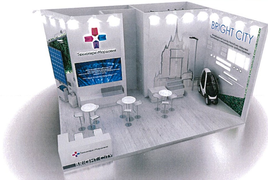
Дизайн - проект принадлежит ООО "ДАРТ", авторство объектов интеллектуальной собственности и ответственность за достоверность информации несет ООО "ДАРТ" в соответствии с законодательством РФ об авторском праве и смежных правах.