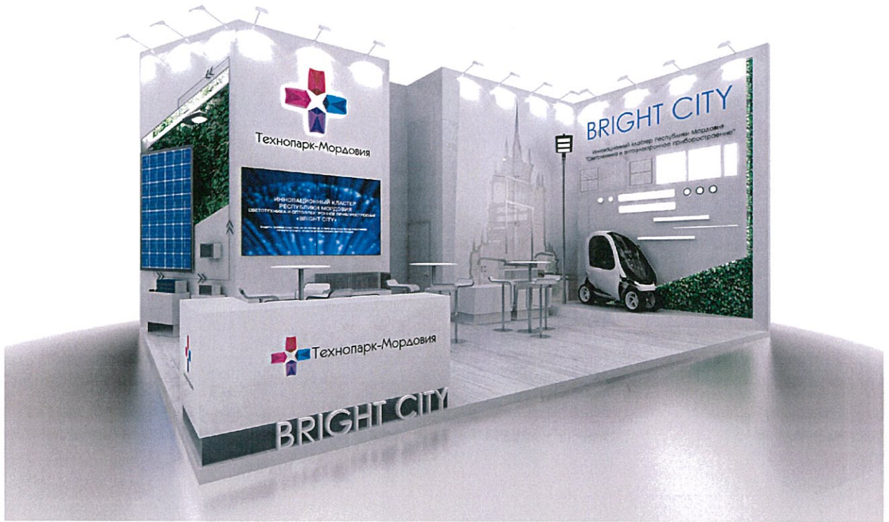
Дизайн - проект принадлежит ООО "ДАРТ", авторство объектов интеллектуальной собственности и ответственность за достоверность информации несет ООО "ДАРТ" в соответствии с законодательством РФ об авторском праве и смежных правах.